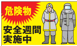
ご希望の団体名を印刷します ティッシュ・救急絆創膏 KAS-3