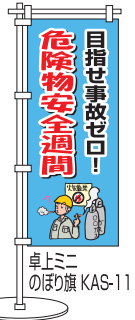
卓上ミニのぼり旗 KAS-11