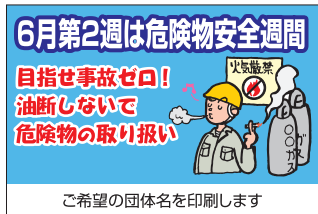
ご希望の団体名を印刷します ティッシュ・救急絆創膏 KAS-5