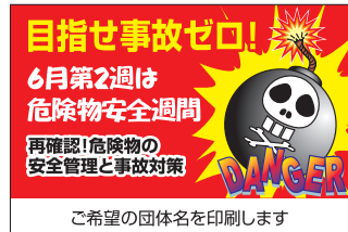
ご希望の団体名を印刷します ティッシュ・救急絆創膏 KAS-6