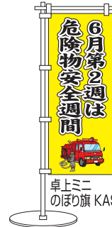
卓上ミニのぼり旗 KAS-9