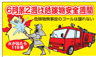
ご希望の団体名を印刷します ティッシュ・救急絆創膏 KAS-4