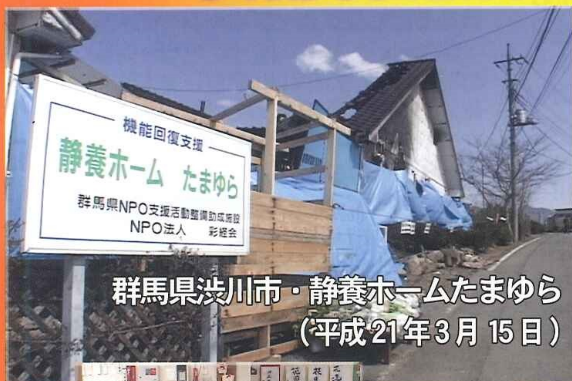
群馬県渋川市・静養ホームたまゆら (平成21年3月15日)