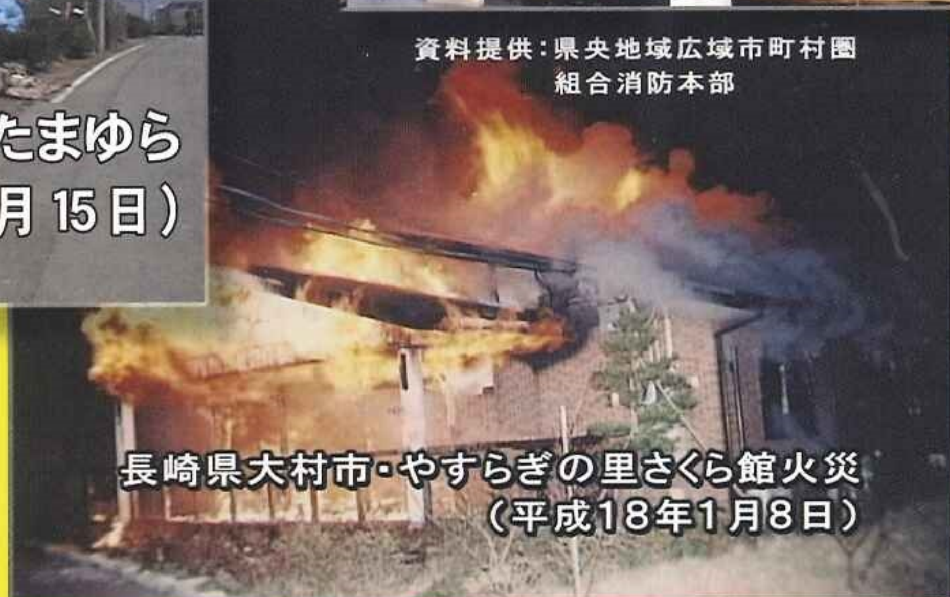
長崎県大村市・やすらぎの里さくら館火災 (平成18年1月8日)