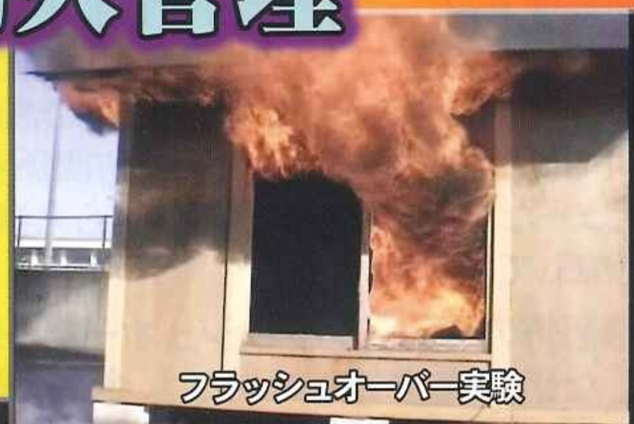
フラッシュオーバー実験