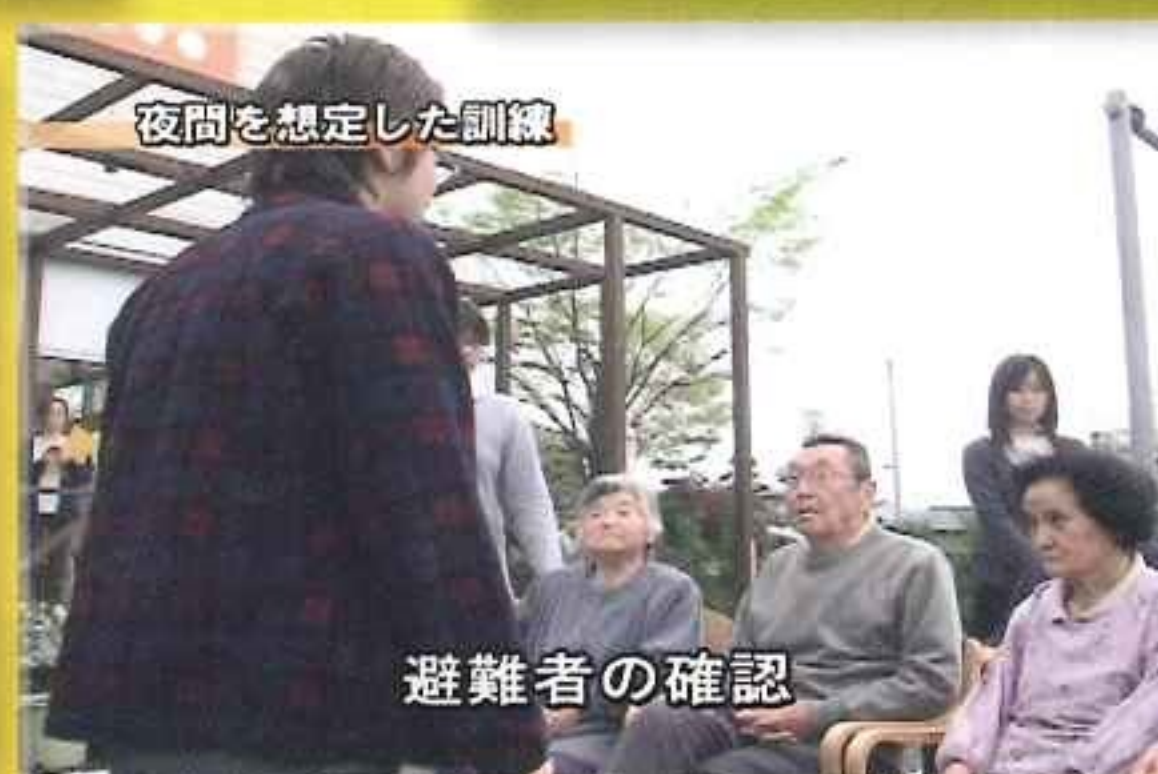
夜間を想定した訓練