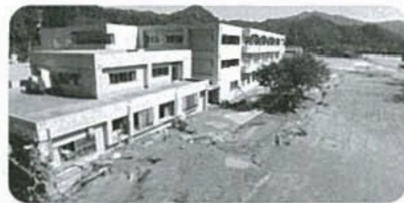
●「平成28年台風10号」による 岩手県浸水被害