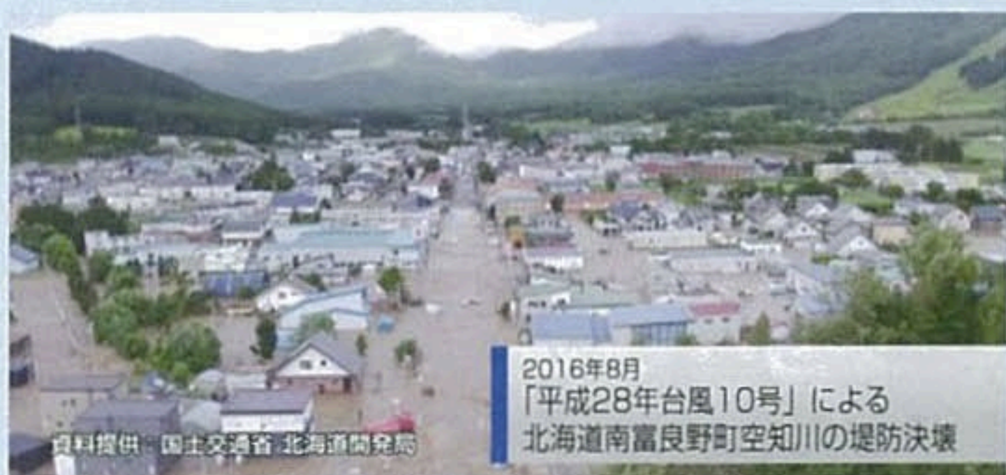
2016年8月 「平成28年台風10号」による 北海道南富良野町空知川の堤防決壊