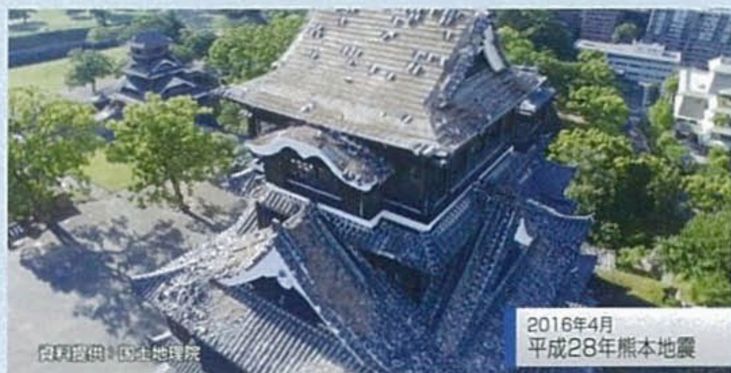
2016年4月 平成28年熊本地震