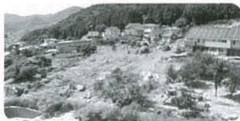
●「平成26年8月豪雨」による 広島市の土砂災害