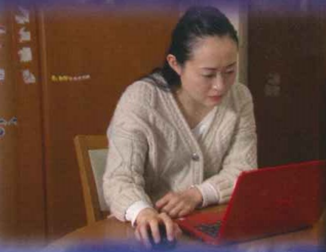
地震調査研究推進本部