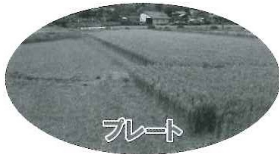
きょうかい きよだい プレート境界の巨大地震しん