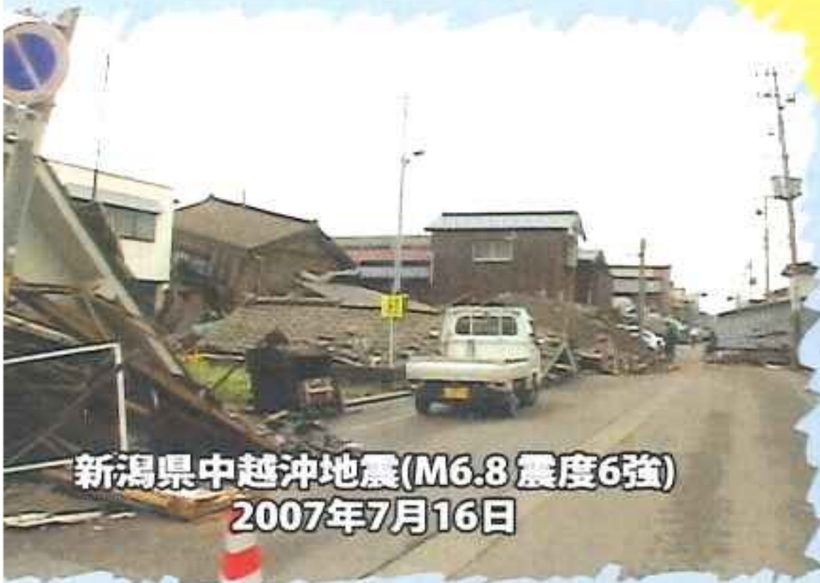
新潟県中越沖地震(M6.8 震度6強) 2007年7月16日