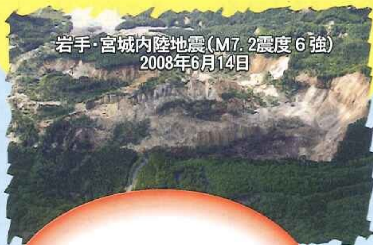
岩手・宮城内陸地震(M7.2 震度6強) 2008年6月14日